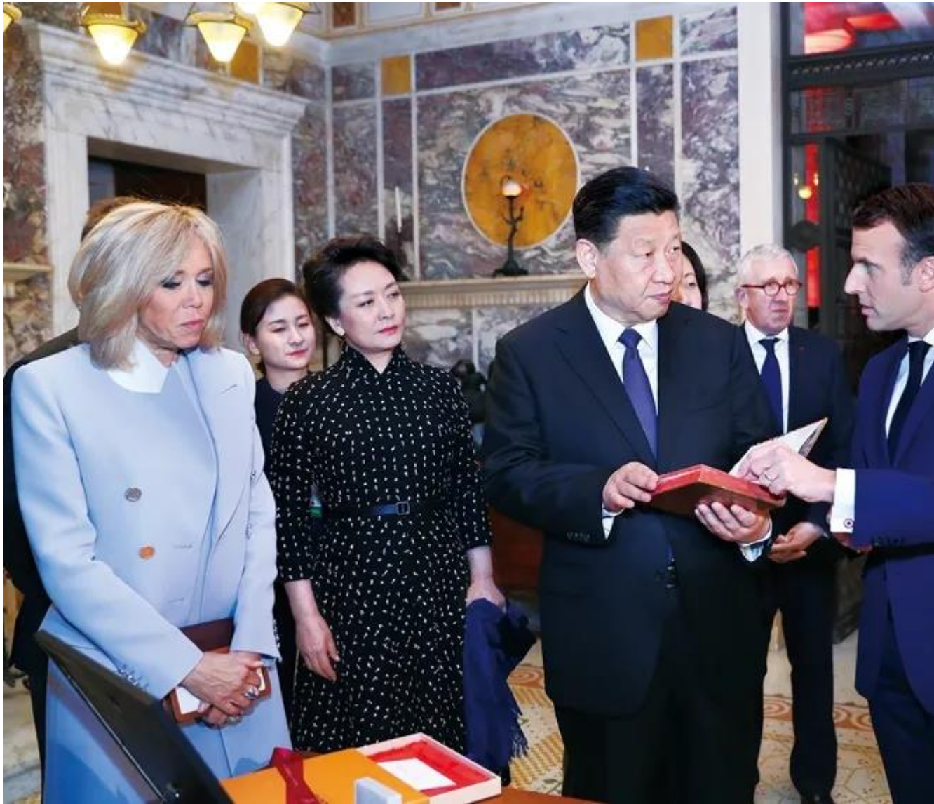
2019年3月24日，习近平在法国尼斯会见法国总统马克龙。会见前，马克龙向习近平赠送1688年法国出版的首部《论语导读》法文版原著。