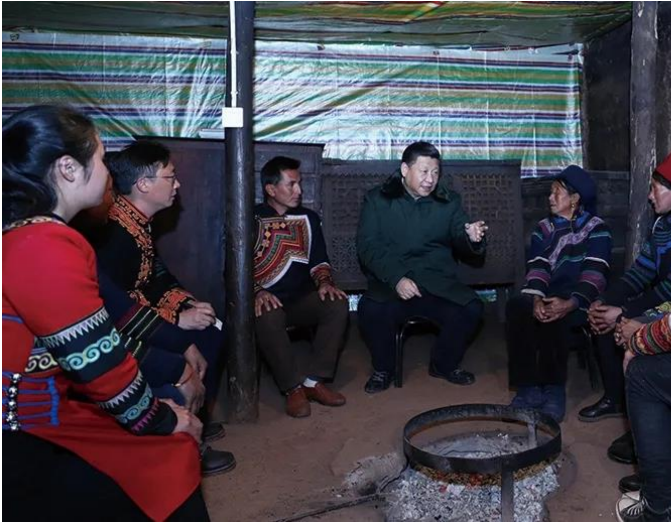
2018年2月12日,习近平在四川成都市主持召开打好精准脱贫攻坚战座谈会。 这是11日,习近平在凉山彝族自治州昭觉县三岔河乡三河村节列俄阿木家中, 同村民代表、驻村扶贫工作人员围坐火塘边,共谋精准脱贫之策。