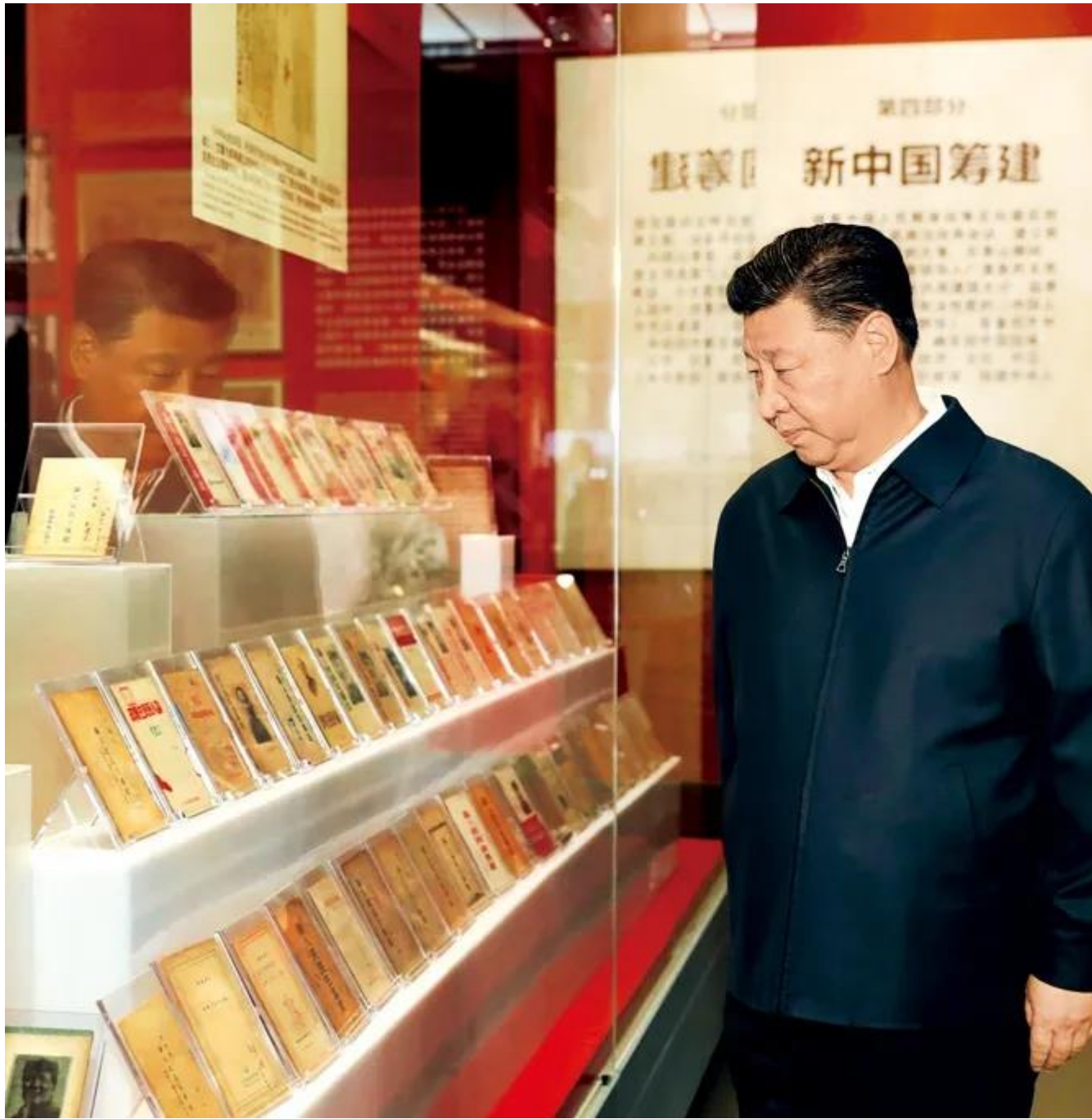
2019年9月12日，习近平视察中共中央北京香山革命纪念地，参观《为新中国奠基》主题展览。