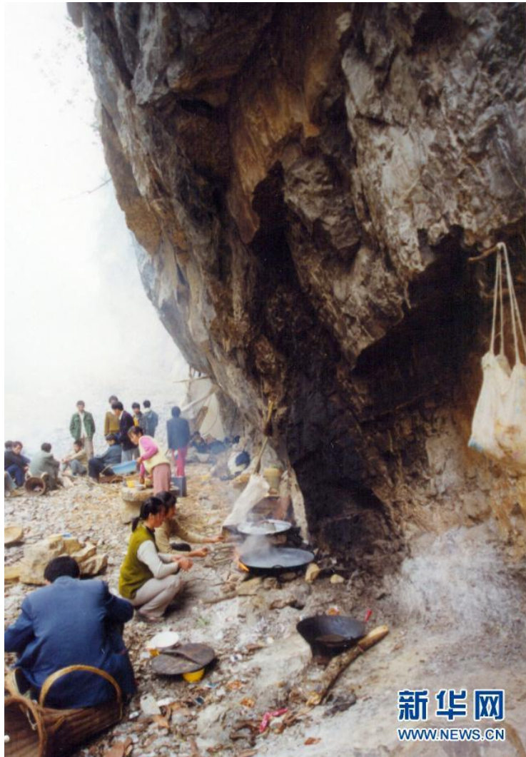
参与修路的下庄村村民把“厨房”搬到了施工现场（资料照片）。