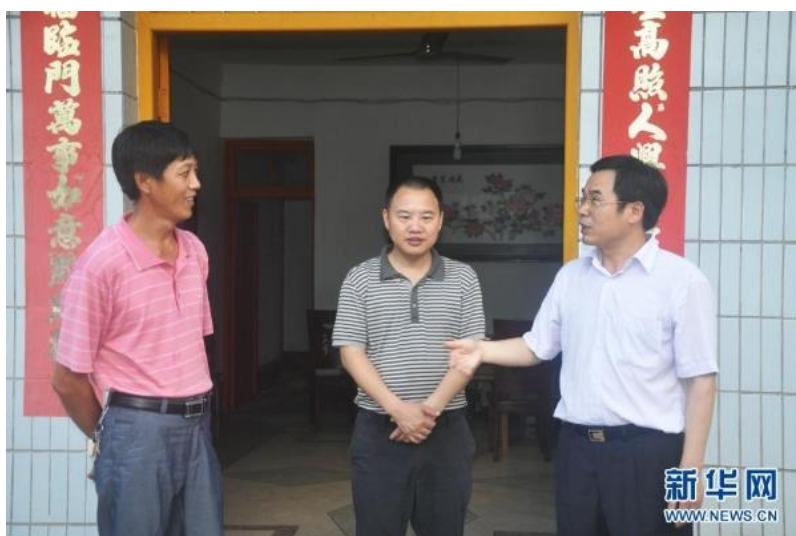
2011 年 7 月，黄诗燕（右一）走村入户调查了解民情。新华社发

惊闻噩耗，当地干部群众悲痛万分；时光流逝，“大黄抓小黄，抓出金黄黄”“最美扶贫书记”等赞许在民间一直广为流传。好口碑印证了黄诗燕生前念兹在兹的一句话：你对群众有多好，群众和你就有多亲。