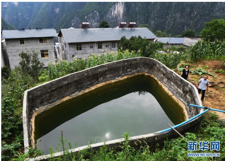
毛相林（前）经过下庄村用于农业生产的水池（2020年7月3日摄）。