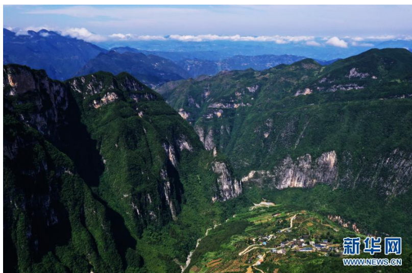
2020年7月3日拍摄的下庄村（无人机照片）。

村民杨亨双回忆，有一次钻炮眼，他站在悬崖边，腿抖得凶，头顶还不时掉碎石。就在那时，毛相林说，你们都别动，我先下去探探底，一个人系上绳子下去了。工地上，遇到危险情况，毛相林总是第一个上，最重的活总是他带头干。