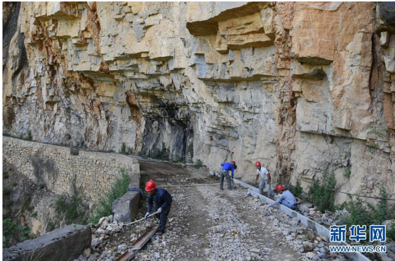
工人对下庄村通往外界的公路进行道路硬化施工(2017年6月7日摄)。